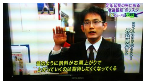
(テレビ出演している代表)