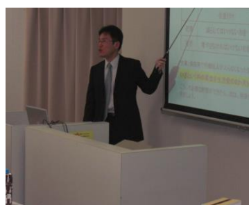
(会場セミナー風景2)

・ ・ ☆ ~ ~ ☆ ~ ☆ ~ ☆ ~ ~ ☆ ☆ ~ ~ ☆ ~ ☆ ~ ☆ ~ ~ ☆ ~