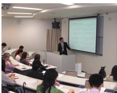
(会場セミナー風景1)