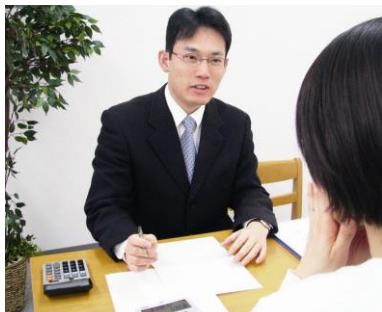
(事務所内相談風景)

それでは、「ぽっかぽか通心」春号は4月初旬発行予定ですので、楽しみにお待ちください。また、ご意見ご感想いただけると、今後の励みになりますのでよろしくお願い致します。